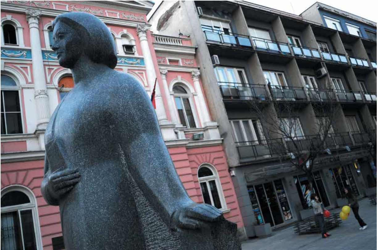
1990 Monumenti i Desanka Maksimović Valjevo, Serbi