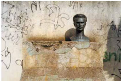
Monumenti i Boro Vukmirović (u hoq nga monumenti) dhe Ramiz Sadikut