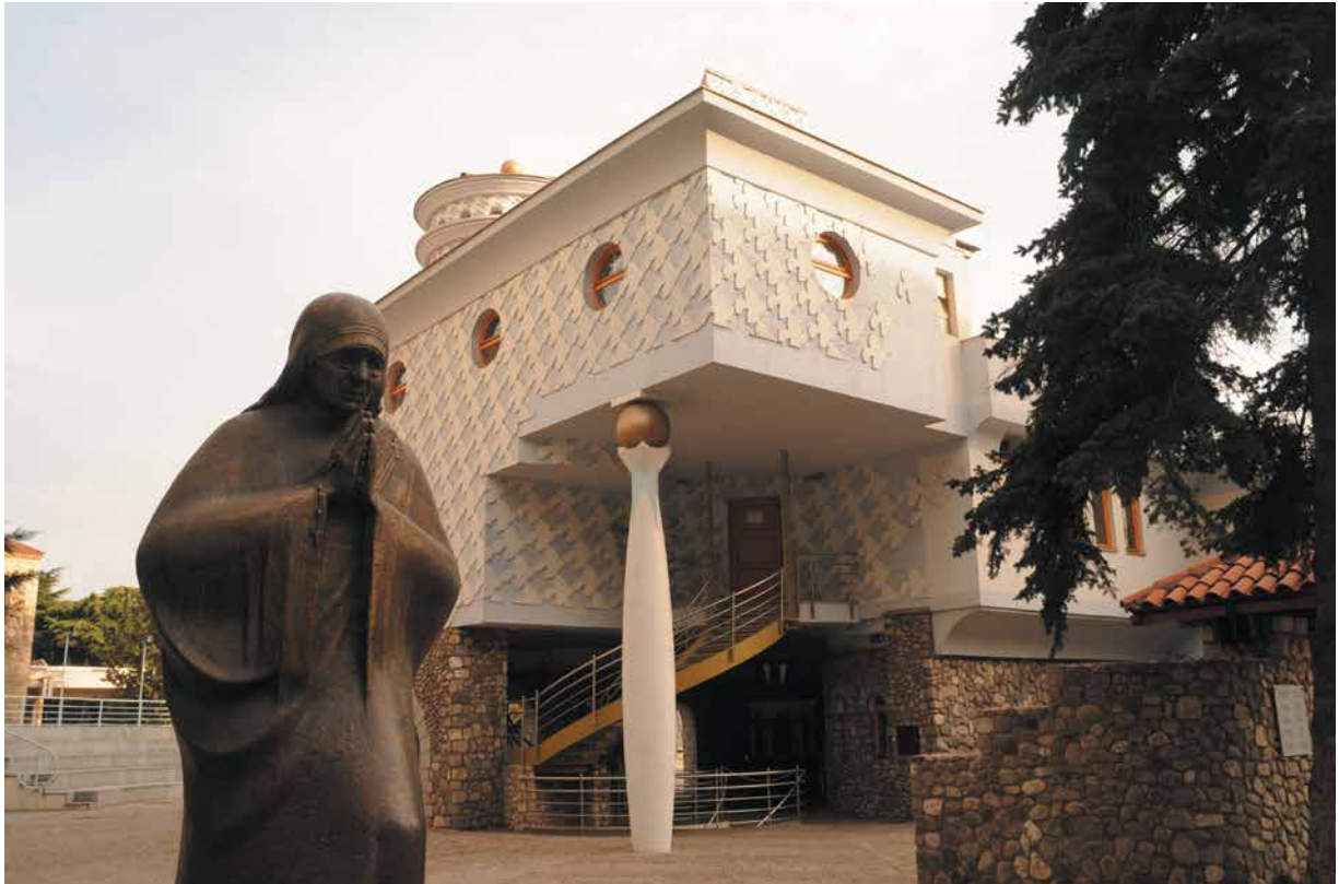
1999 Monumenti i Nënë Terezës, Shkup, Maqedoni