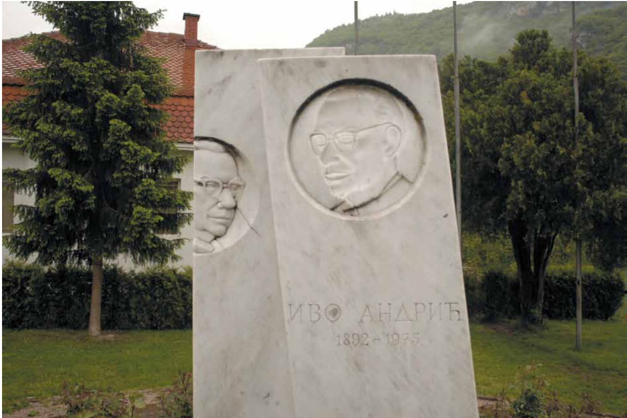
1994 “Krajputaš” – Monumenti i Ivo Andrić, Vishegrad, Bosnje e Hercegovinë