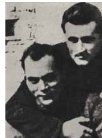
Boro V. (majtas) dhe Ramiz S.