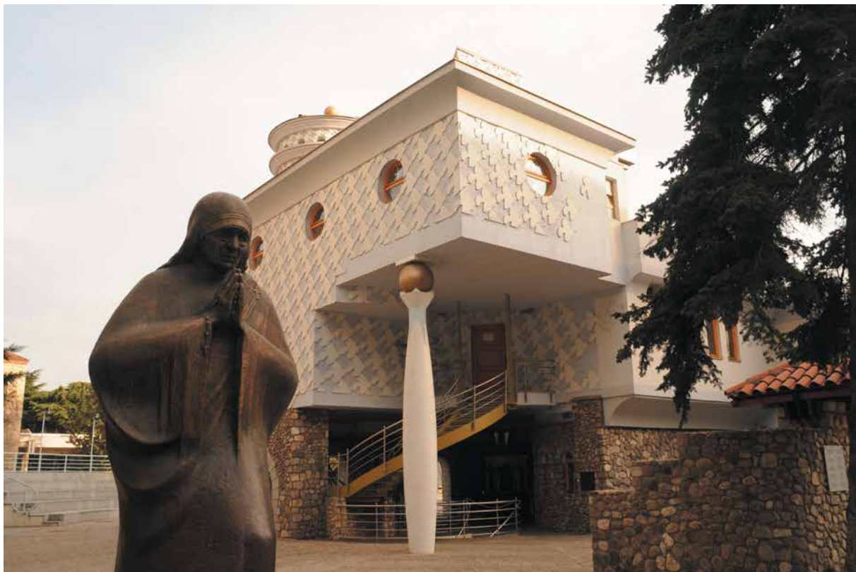
1999 Споменик на Мајка Тереза, Скопје, Македонија