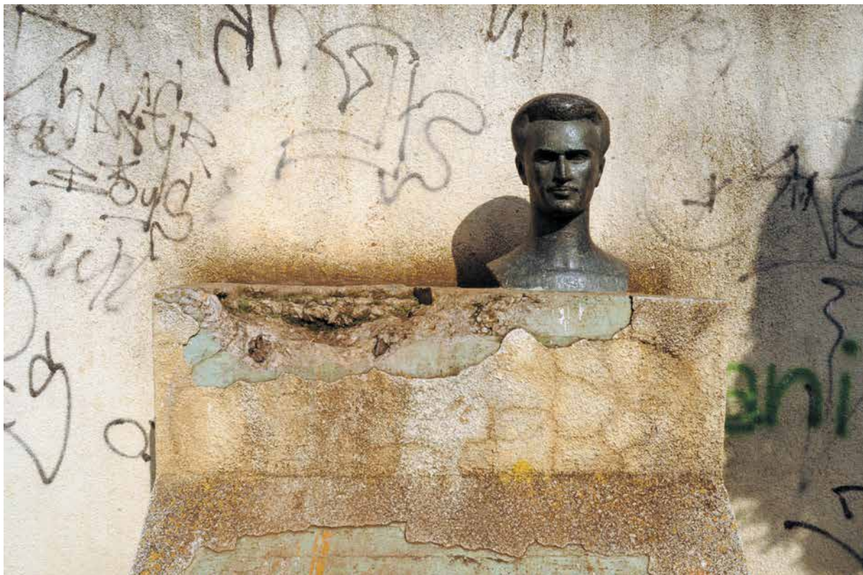
1961 Споменикот на Боро Вукмировиќ и Рамиз Садику, Приштина, Косово