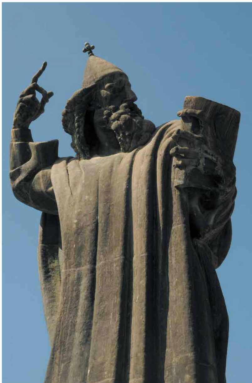
1929 Споменик на Гргур Нински, Сплит, Хрватска