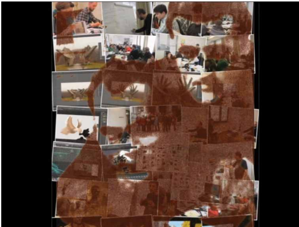
Сцена од создавањето на материјалот МОНУМЕНТИМОУШН, автор Мухамед Кафеџиќ Муха