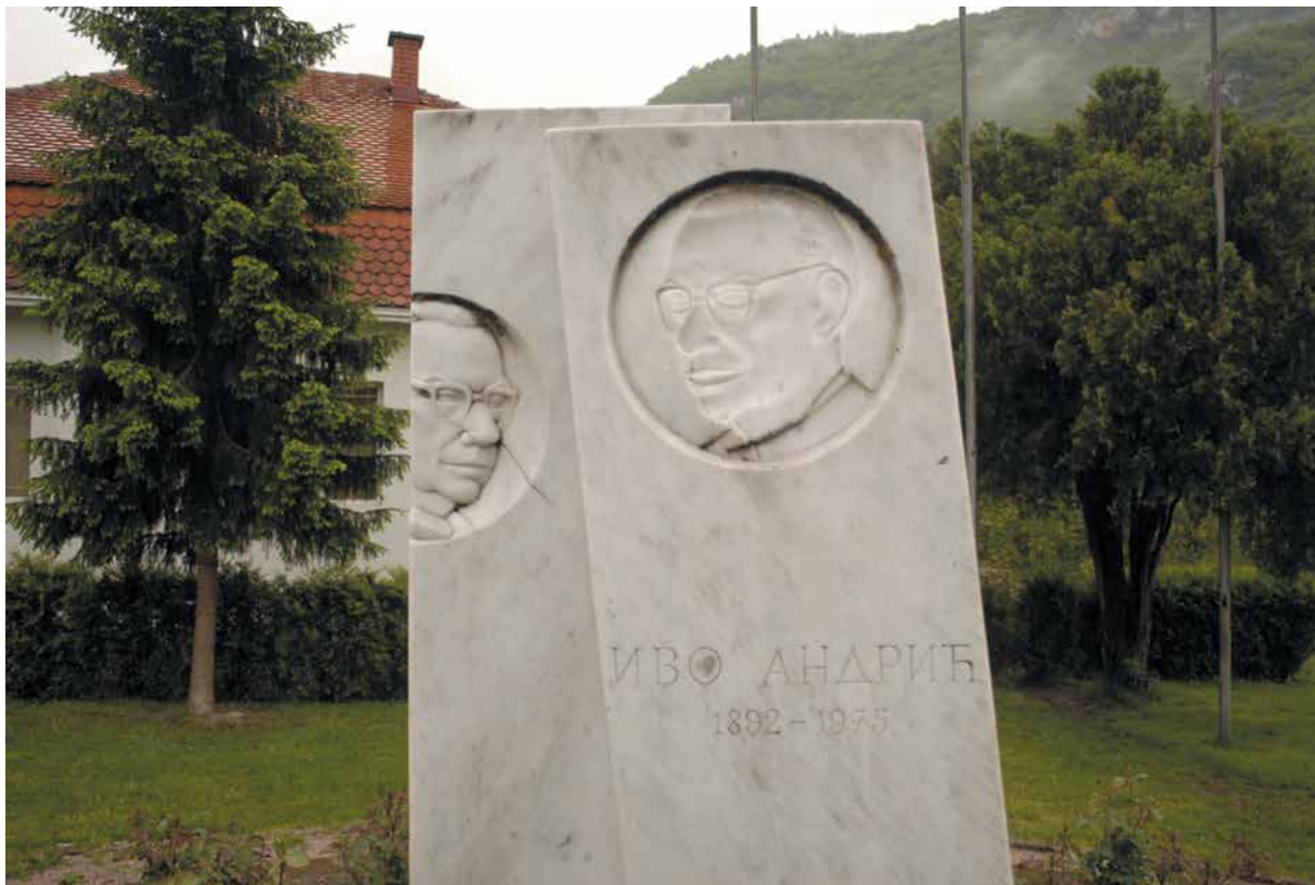
1994 “Надгробен споменик” – Споменик на Иво Андриќ, Вишеград, Босна и Херцеговина