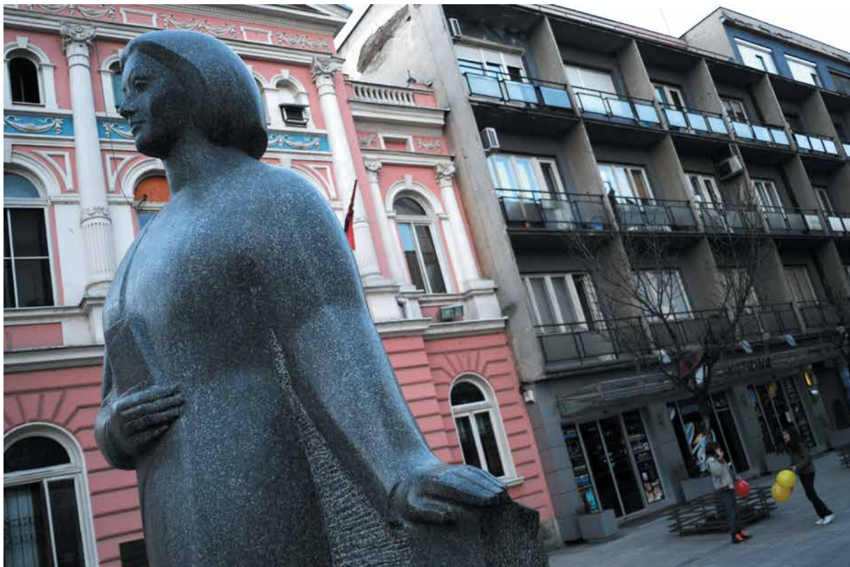
1990 Споменик на Десанка Максимовиќ, Ваљево, Србија